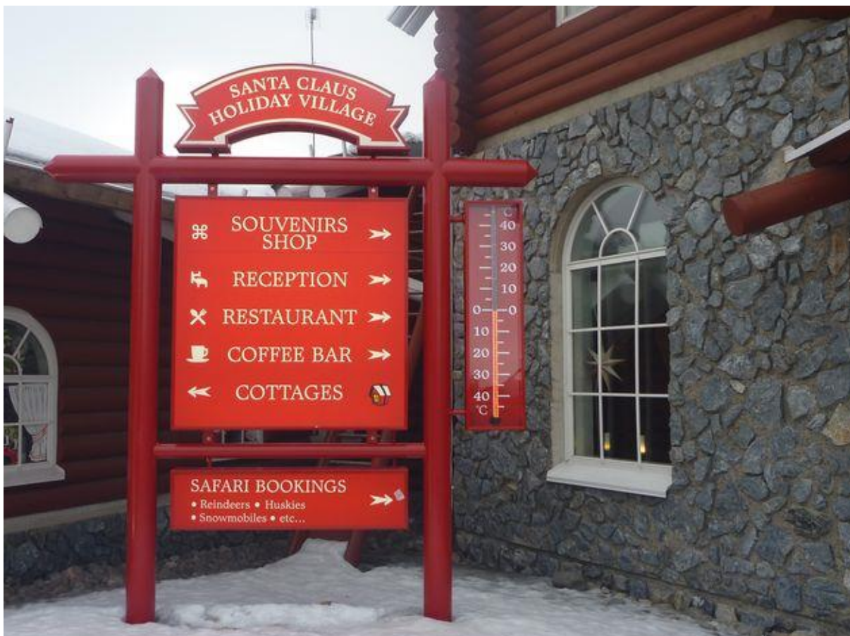
Vše bylo podřízeno komerci