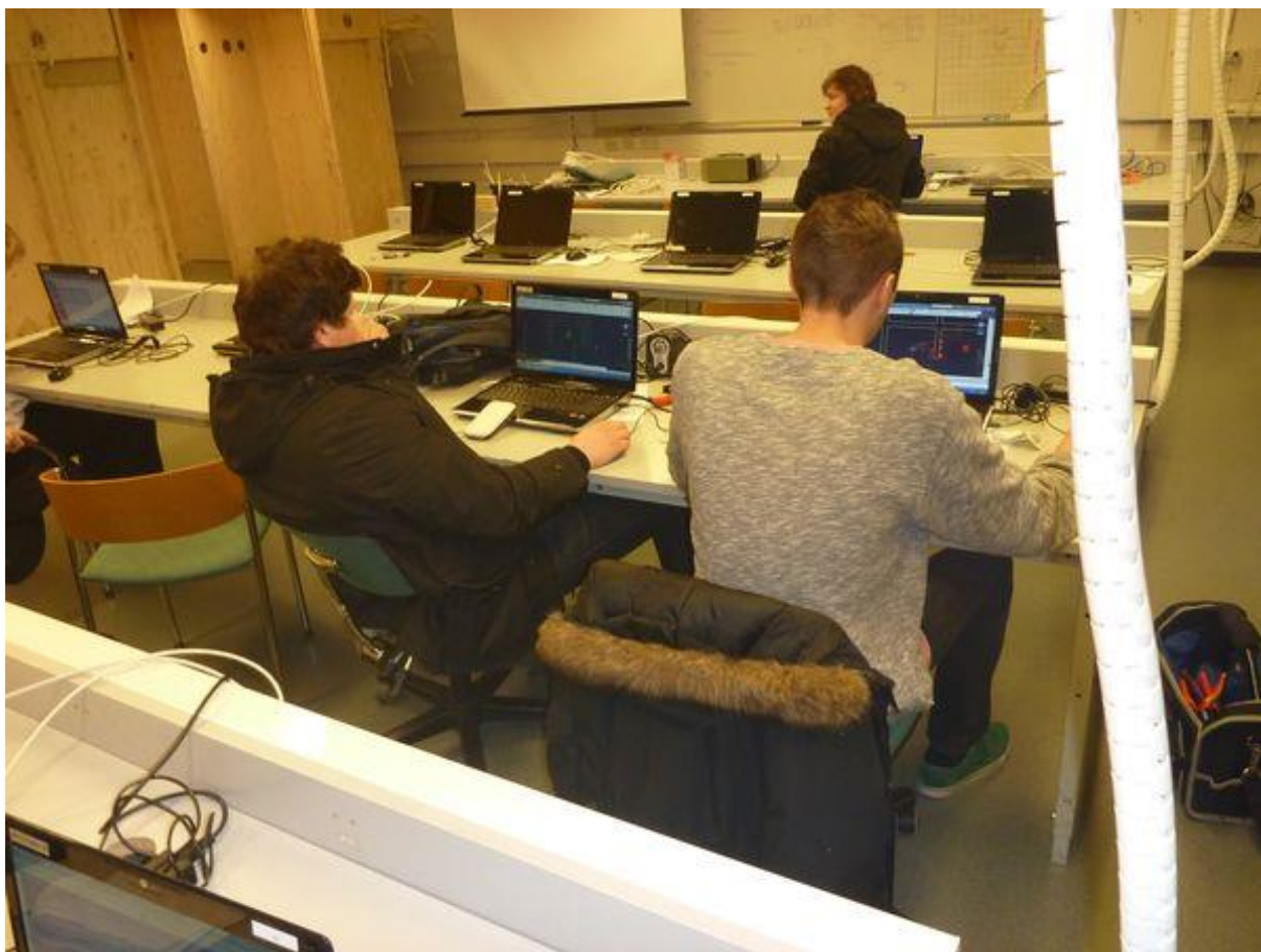
Jedna z učeben, kde mohlo probíhat obojí ;-)

Naše exkurze po školách byly směřovány hlavně do učeben praxe, i když u leckteré učebny nebylo až tak jasné, jestli je pro teorii nebo praxi ;-)