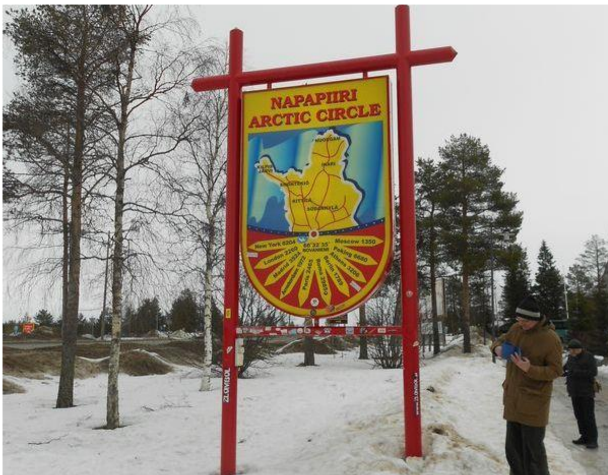
U severního polárního kruhu