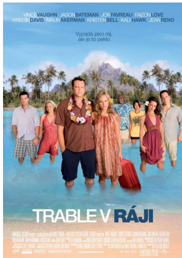
Trable v ráji

Pobyt na nádherném exotickém ostrově jako lék na manželskou krizi? Proč ne. Jenže když váš vztah hrozí zhroutilím, může se i ráj proměnit v peklo na Zemi. V tomhle nezáviděníhodném aranžmá se naštěstí ocitají skvělí američtí komici v čele s Vincem Vaughnem, takže lze očekávat, že si jejich utrpení budete náležitě užívat. Čtyři vztahy v různé fázi partnerské spokojenosti. Dave (Vince Vaughn) a Ronnie (Malin Akerman) žijí v příšerném stereotypu, ale snaží si to nepřipouštět. Joemu (Jon Favreau) a Lucy (Kristin Davis) drží manželství jen silou vůle, Shaneovi (Faizon Love) už držet přestalo, a tak si nabalil novou holku, o pěkných pár let mladší. Jediný solidní vztah mají Jason (Jason Bateman) a Cynthia (Kristen Bell), jenže, jak se ukáže, je to jen pracně udržovaná fasáda, která při setkání s výše zmíněnými přáteli najednou spadne. Aby zachránili, co se dá, kývnou Jason a Cynthia na nabídku partnerské terapie v ostrovním tichomořském ráji Eden Resort. A protože toto letovisko nabízí úžasné skupinové slevy, vezmou spřátelené dvojčky s sebou.